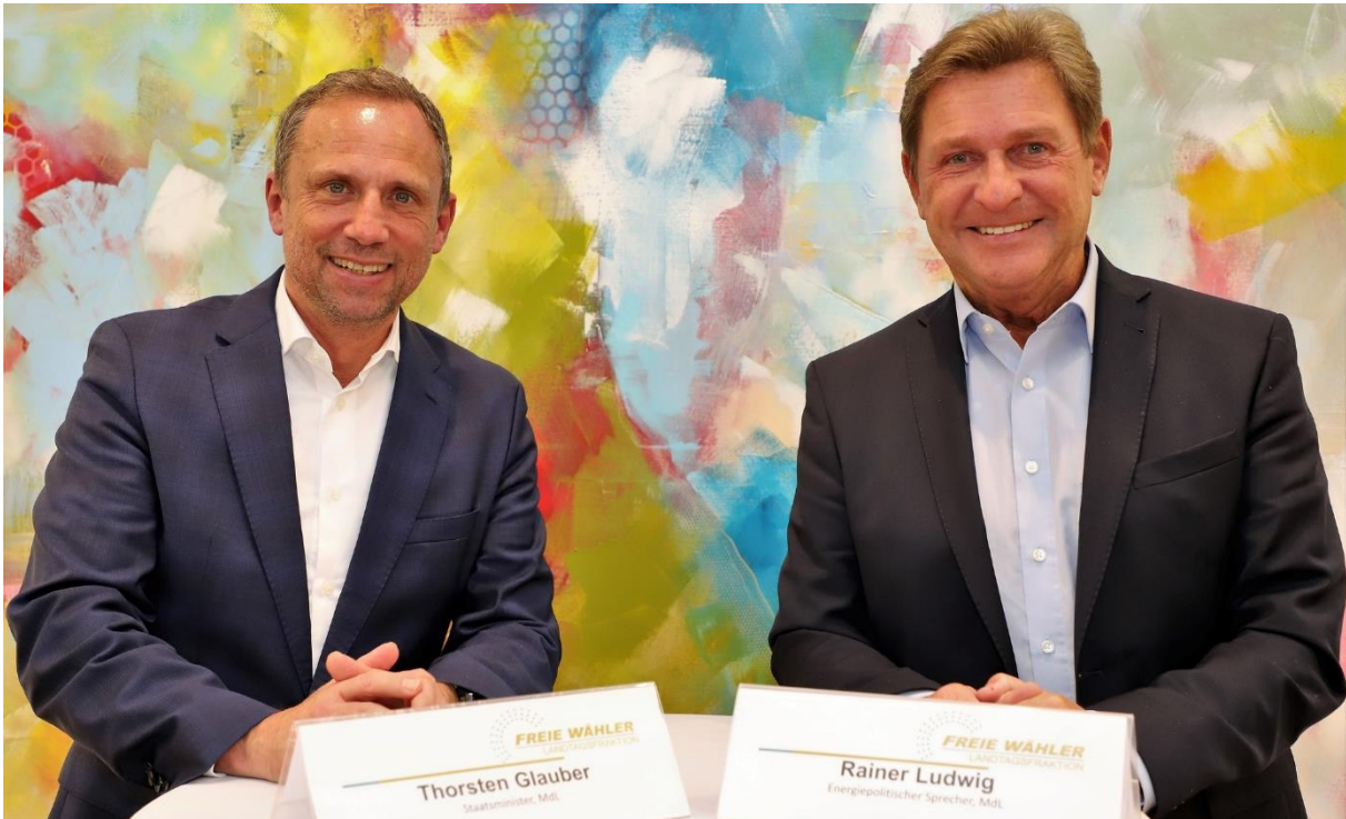
"Fraktion vor Ort" in Hausen/Forchheim: Thema: Klimawandel - geht Oberfranken das Wasser aus?

Auf Initiative von MdL Rainer Ludwig: Kammern diskutieren beim Schulgipfel Vorschläge mit Kultusminister Piazzolo